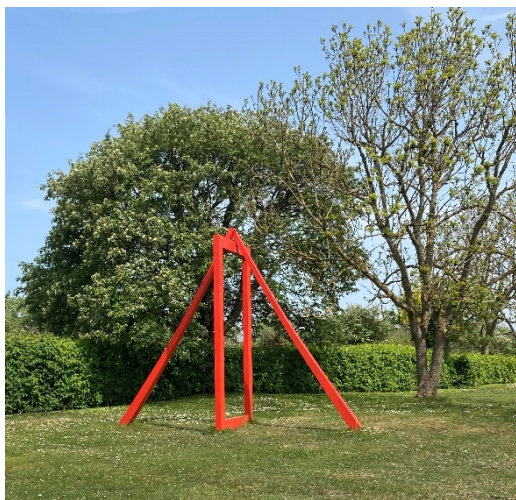
Bildtext: Gateway, B E Evensen (vänster) och skulpturer av Siri Carlén (nedan), båda ägs av stiftelsen.

Under 2021 bidrog föreningen med 70 000 till Stiftelsen vidförverkligandet av Siri Carléns skulpturgrupp "Gänget"