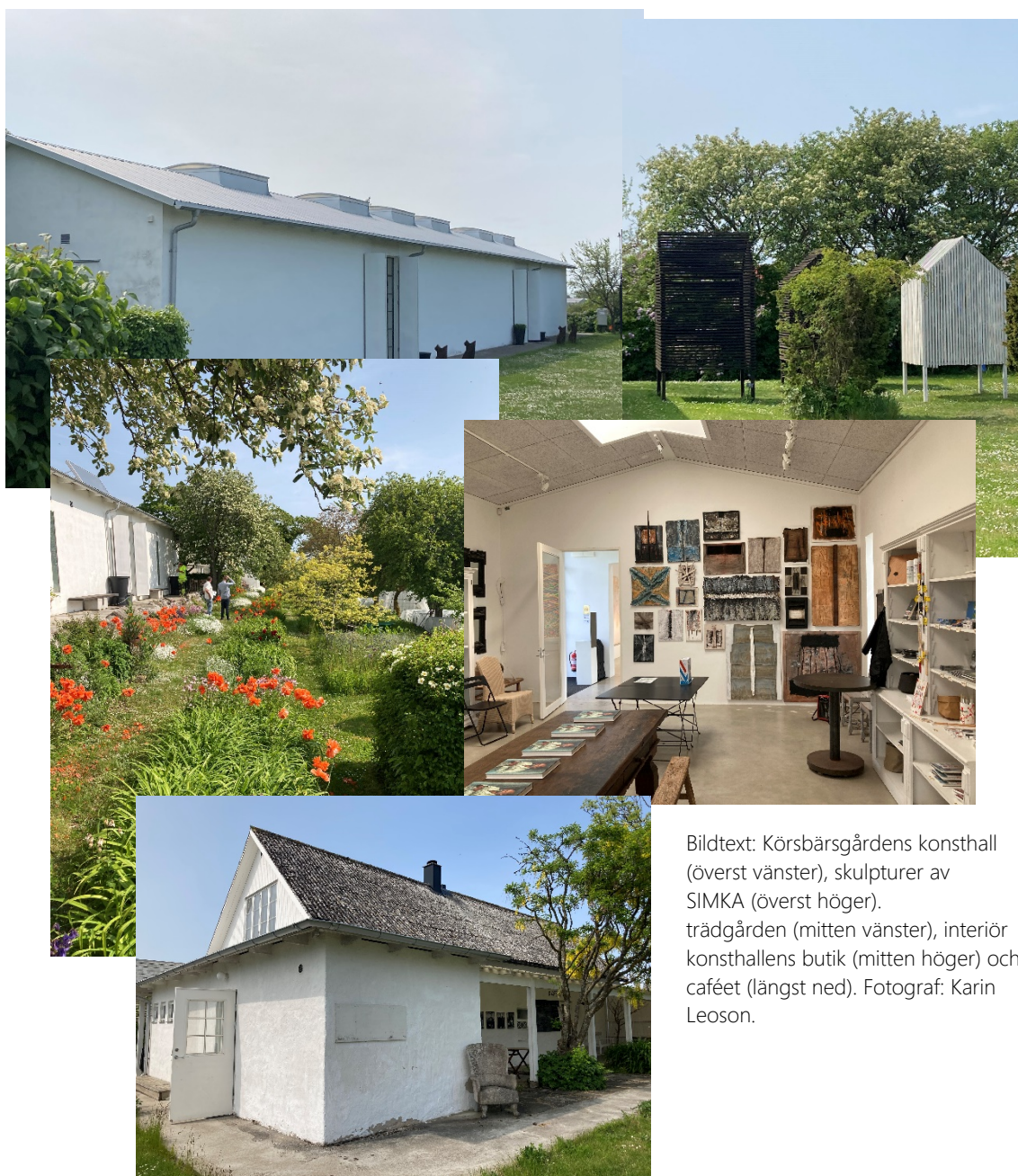
Bildtext: Körsbärsgårdens konsthall (överst vänster), skulpturer av SIMKA (överst höger), trädgården (mitten vänster), interiör konsthallens butik (mitten höger) och caféet (längst ned).